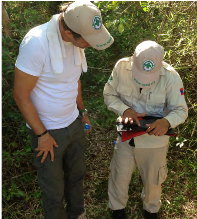
ພະນັກງານອົງການເອັນພີເອນຳໃຊ້ແທບເລຼດສຳລັບການລາຍງານ.

ພວກເຮົາດຳເນີນງານ ເພື່ອປັບປຸງ ແລະ ຮັກສາສາຍສຳພັນທີ່ດີໃນການເຮັດວຽກຮ່ວມກັບຄູ່ຮ່ວມງານຕ່າງໆ.