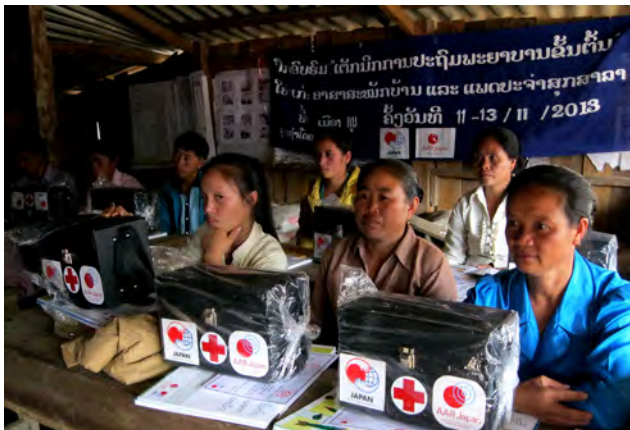
ອາສາສະໜັກສຸກສາລາຂັ້ນບ້ານ ໄດ້ຮັບການຝຶກອົບຮົມກ່ຽວກັບການປະຖົມພະຍາບານ, ປຶ້ມນ້ອຍ, ແຜນພັບ ແລະ ໂພດສະເຕີ ພາຍຫຼັງສຳເລັດການຝຶກອົບຮົມ.

ສະມາຄົມຊ່ວຍເຫຼືອລ້າ ແລະ ບັນເທົາທຸກຂອງຍີ່ປຸ່ນ (ເອເອອາຣ) (ເຮັດກິດຈະກຳໂຄສະນາສຶກສາຄວາມສ່ຽງ ຈາກ ລບຕ)