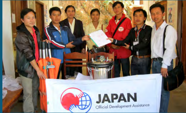
ອົງການເອເອອາຣ໌ ມອບອຸປະກອນສຳລັບການດູແລປື້ນປົວບາດແຕ່ ໄຫແກສຸກສາລາ ໃນນາມຕາງໜ້າໄທພະນັກງານໂຮງໝໍເມືອງ.