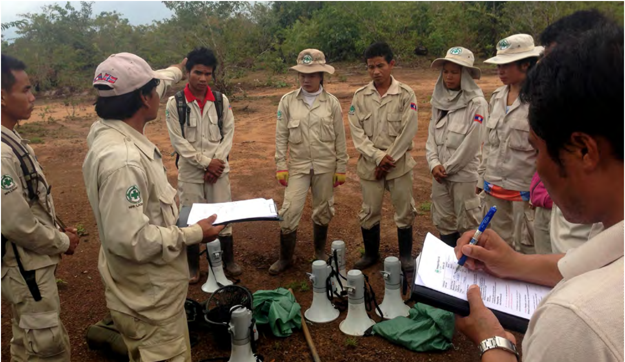
ຫົວໜ້າທີມງານສຳຫຼວດເພື່ອກຳນົດພື້ນທີ່ລະເບີດລູກຫວ່ານ ຕົກຄ້າງ ກຳລັງໃຫ້ຄຳແນະນຳແກ່ລູກທີມຂອງຕົນເອງ.