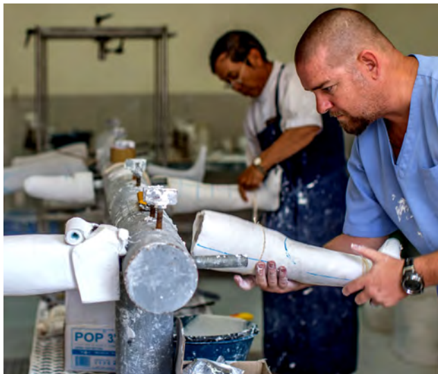
ພະນັກງານຂອງອົງການໂຄບ ແລະ ພະນັກງານເຮັດວຽກຜະລິດອົງຄະທຽມ ແລະ ເຄື່ອງຄໍາຊູ ກຳລັງເຮັດວຽກຮ່ວມກັນ ເພື່ອຜະລິດແຂນຂາທຽມ ໃຫ້ແກ່ ຄົນເຈັບ.

ນອກຈາກນັ້ນ, ອົງການໂຄບ ຍັງໄດ້ຈັດກອງປະຊຸມສຳມະນາຂຶ້ນໃນ ເດືອນພະຈິກ ກຽວກັບການຄວບຄຸມຄຸນນະພາບໃຫ້ແກ່ພະນັກງານພະ