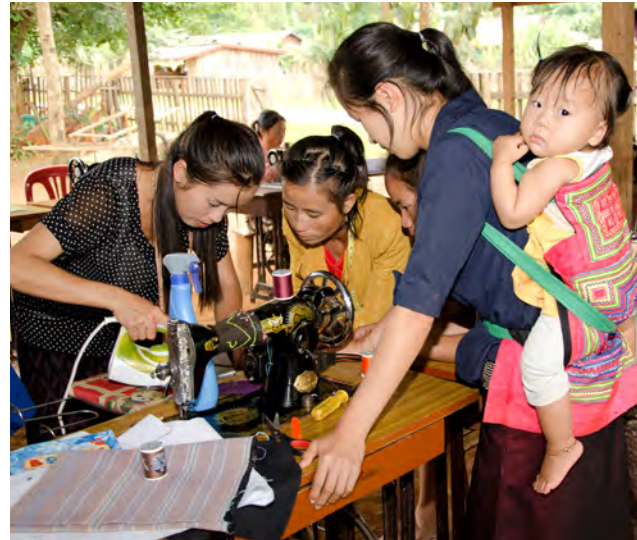
ການຝຶກອົບຮົມກ່ຽວກັບການເຮັດຫັດຖະກຳ ຈັດຂຶ້ນ ໂດຍສະມາຄົມ ປັບປຸງຄຸນນະພາບຊີວິດ ຢູ່ທີ່ບ້ານໄທທິນ.

ປະຈຸບັນນີ້ ມີກຸ່ມຜະລິດຢູ່ 21 ກຸ່ມ ຢູ່ໃນ 18 ບ້ານ ຂອງເມືອງຄູນ, ຜູງ ໄຊ, ແປກ ແລະ ຄຳ ລວມມີສະມາຊິກທັງໝົດ 365 ຄົນ (ລວມມີຜູ້ ລອດຊີວິດຈາກ ລບຕ, ຄົນພິການ ແລະ ປະຊາຊົນທີ່ທຸກຍາກທີ່ສຸດຢູ່ ໃນບ້ານ), ສະມາຄົມປັບປຸງຄຸນນະພາບຊີວິດ ເຮັດວຽກຢ່າງໃກ້ຊິດກັບ ພະແນກປົນປົວສຸຂະພາບ, ໂຮງຮຽນຝຶກວິຊາຊີບຂອງແຂວງຊຽງຂວາງ ແລະ ທຸກໆການບານຕ່າງໆ ເພື່ອທົບທວນຄືນກິດຈະກຳ, ບົດຮຽນທີ່ຖອດ ຖອນໄດ້ ແລະ ການວາງແຜນວຽກ.