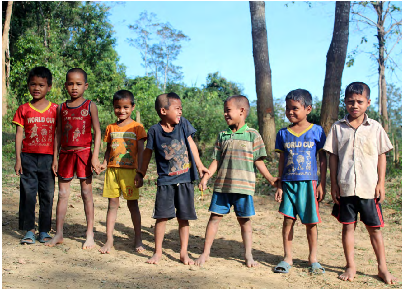
ປະຈຸບັນນີ້ ເດັກນ້ອຍທີ່ອາໄສຢູ່ບ້ານລາເຕືອງ ແມ່ນສາມາດແລ່ນຫຼິ້ນຢູ່ໃນຊຸມຊົນໄດ້ຢ່າງປອດໄພ. ຍ້ອນວ່າ ອົງການເຮໂລທູດ ໄດ້ດຳ ເນີນກິດຈະກຳໂຄສະນາສຶກສາຄວາມສູງຈາກ ລບຕ, ການສຳຫຼວດທົ່ວໄປ ແລະ ການກວດກູ້ ລບຕ ຢູ່ພາຍໃນບ້ານຂອງເຂົາເຈົ້າ.

ຄູ່ຮ່ວມງານຂອງອົງການເຮໂລທູດ ປະກອບມີ ອົງການພັດທະ ນາ ແລະ ອຳນາດການປົກຄອງທ້ອງຖິ່ນຕ່າງໆ, ຊຶ່ງພາກສ່ວນ ເຫຼົ່ານີ້ ແມ່ນມີບົດບາດສຳຄັນຫຼາຍຕໍ່ການດຳເນີນງານຂອງອົງ ການເຮໂລທູດ. ຜ່ານການຮ່ວມມື ແລະ ມີການພົວພັນທີ່ດີ ກັບພາກສ່ວນຂອງເທິງນີ້ ຈຶ່ງເຮັດໃຫ້ອົງການເຮໂລທູດ ສາມາດ ກຳນົດເປົ້າໝາຍໃນການເຮັດວຽກໄດ້ເປັນຢ່າງດີ ແລະ ເຂົ້າເຖິງ ຜູ້ໄດ້ຮັບຜົນປະໂຫຍດຈາກການສຳຫຼວດ ແລະ ການເກັບກູ້. ອົງ ການເຮໂລທູດ ໄດ້ເຮັດວຽກຮ່ວມກັບອົງການພັດທະນາສາກົນ ຕ່າງໆຫຼາຍໆໂຄງການທີ່ກຳລັງປະຕິບັດງານຢູ່ແຂວງສະ ຫວັນນະເຂດ ເຊັ່ນວ່າ: ອົງການເວວທັງເກີຣີບ, ອົງການບັນເທົາ ທຸກຂອງກາໂຕລິກ ແລະ ອົງການສຸພະນິມິດ ເປັນຕົ້ນ. ເພື່ອເຮັດ ໃຫ້ທຶນຊ່ວຍເຫຼືອຂອງຜູ້ໃຫ້ທຶນເກີດຜົນປະໂຫຍດຫຼາຍຢ່າງ ອົງ ການເຮໂລທູດ ເຊື່ອໝັ້ນວ່າ ຜົນໄດ້ຮັບຈາກການທີ່ໄດ້ເຮັດ ວຽກ ເພື່ອມະນຸດສະທຳນັ້ນ ແມ່ນຈະສົ່ງຜົນກະທົບດ່ານບວກ ໃຫ້ແກ່ຊຸມຊົນທີ່ມີຜົນກະທົບຈາກ ລບຕ ຢູ່ແຂວງສະຫວັນນະ ເຂດ. ໂຮງຮຽນຕ່າງໆທີ່ອົງການບັນເທົາທຸກຂອງກາໂຕລິກ ໄດ້ປະຕິບັດໂຄງການສະໜອງອາຫານທຽນນັ້ນ ແມ່ນໄດ້ຖືກກຳ ນົດເປັນເປົ້າໝາຍໃນການດຳເນີນກິດຈະກຳໂຄສະນາສຶກສາ ຄວາມສູງຈາກ ລບຕ ຂອງອົງການ ເພື່ອແນໃສ່ເຮັດໃຫ້ເດັກ ນອຍ ສາມາດເຂົ້າເຖິງກິດຈະກຳໂຄສະນາສຶກສາຄວາມສູງ