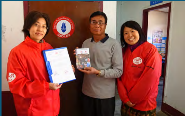
ອົງການເອເອອາຣ໌ ໄດ້ພາກັນແຕ່ງບົດເພັງ ກ່ຽວກັບການໂຄສະນາສຶກສາຄວາມສູງຈາກ ລບຕ ເພື່ອສະໜັບສະໜູນການດຳເນີນກິດຈະກຳໂຄສະນາສຶກສາຄວາມສູງຈາກ ລບຕ ຂອງຄາລ ຢູ່ແຂວງຊຽງຂວາງ.