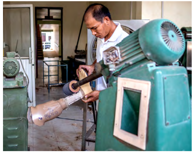
ການສະໜອງອຸປະກອນທີ່ຈຳເປັນ ແລະ ຝຶກອົບຮົມທາງດ້ານເຕັກນິກ ວິຊາການໃຫ້ແກ່ພະນັກງານ ແມ່ນວຽກງານສະໜັບສະໜູນທີ່ສຳຄັນ ຂອງອົງການໂຄບ.

ໃນຊ່ວງກ່າວເປີດກອງປະຊຸມສຳມະນາຢ່າງເປັນທາງການນັ້ນ ລັດຖະ ມົນຕີວ່າການກະຊວງສາທາລະນະສຸກ ທ່ານ ສາດສະດາຈານ ດຣ