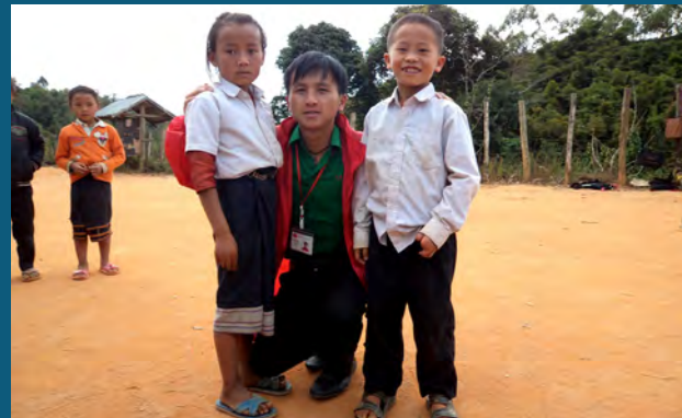
ພະນັກງານຂອງອົງການເອເອອາຣ໌ ລົງຢ້ຽມຢາມຜູ້ຖືກເຄາະຮ້າຍຈາກ ລບຕ ເພື່ອເຕັບກຳຂໍ້ມູນ. ເດັກສອງຄົນນີ້ ແມ່ນຜູ້ຖືກເຄາະຮ້າຍຈາກ ລບຕ ຢູ່ເມືອງຄຳ.