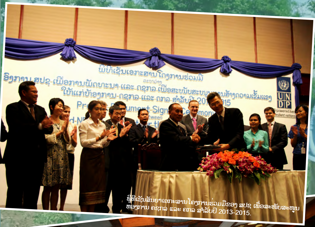
ພິທີເຊັນສັນຍາເອກະສານໂຄງການຮ່ວມມືຂອງ ສປຊ ເພື່ອສະໜັບສະໜູນ ຫ້ອງການ ຄຸຊກລ ແລະ ຄກລ ສຳລັບປີ 2013-2015.