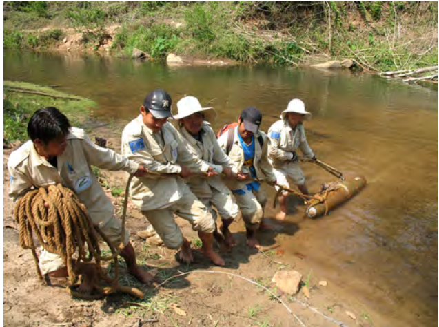
ການດຳເນີນງານຂອງທີມງານທຳລາຍເຄື່ອນທີ່ ຢູ່ເມືອງນອງ ໃນປີ 2013.