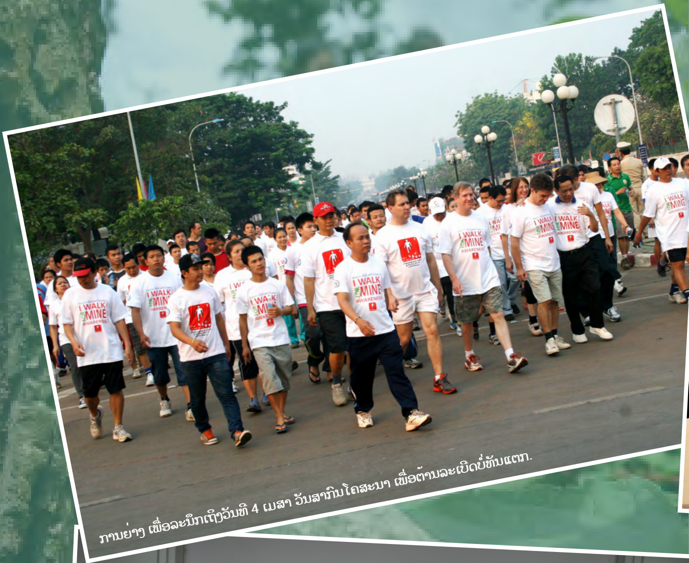
ການຍ່າງ ເພື່ອລະນຶກເຖິງວັນທີ 4 ເມສາ ວັນສາກົນໂຄສະນາ ເພື່ອຕ້ານລະເບີດບໍ່ທັນແຕກ.