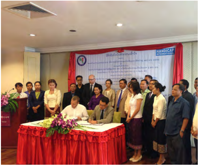
ພິທີເຊັນບົດບັນທຶກຄວາມເຂົ້າໃຈລະຫວ່າງທ້ອງຖານ ຄຊກລ ແລະ ອົງການເຫັດໄອ ໃນເດືອນກໍລະກົດ 2013, ທີ່ໂຮງແຮມ ໂນໂວເທວ.

ນອກຈາກນັ້ນ, ອົງການເຫັດໄອ ຍັງໄດ້ໃຫ້ການສະໜັບສະໜູນທ້ອງຖານປະສານງານ ຄຊກລ ປະຈຳແຂວງສະຫວັນນະເຂດ,