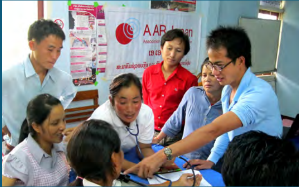
ພະຍາບານປະຈຳສຸກສາລາ ຝຶກແອບການວັດແທກຄວາມດັນເລືອດ ໃນຂະນະຝຶກອົບຮົມ.