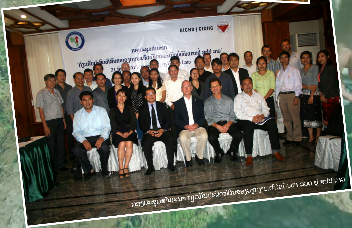
ກອງປະຊຸມສຳມະນາ ກ່ຽວກັບປະສິດທິຜົນຂອງວຽກງານແກ້ໄຂບັນຫາ ລບຕ ຢູ່ ສປປ ລາວ