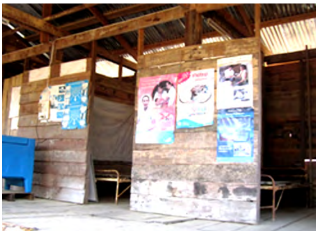
ສຸກສາລາບ້ານນາກະພໍ້ ມີພຽງແຕ່ອາສາສະໝັກສຸກສາລາຂັ້ນບ້ານ ພຽງຄົນດຽວ ແລະ ແພດ 2-3 ຄົນ ປະຈຳຢູ່