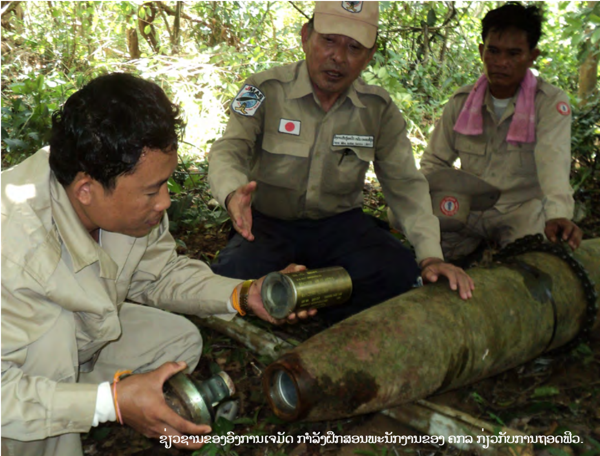
ຊ່ວຍຊານຂອງອົງການເຈມັດ ກຳລັງຝຶກສອນພະນັກງານຂອງ ຄກລ ກ່ຽວກັບການຖອດຟ້ວ.