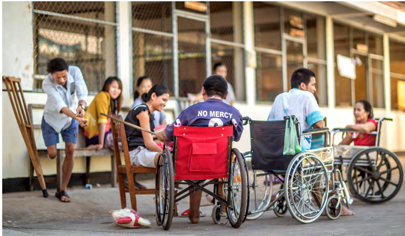
ກຸ່ມຄົນພິການ ໃຊ້ເວລານຶ່ງລົມກັນຫຼິ້ນຢູ່ທາງດ້ານນອກສູນການແພດ ແລະ ພື້ນພູໜ້າທີ່ການ