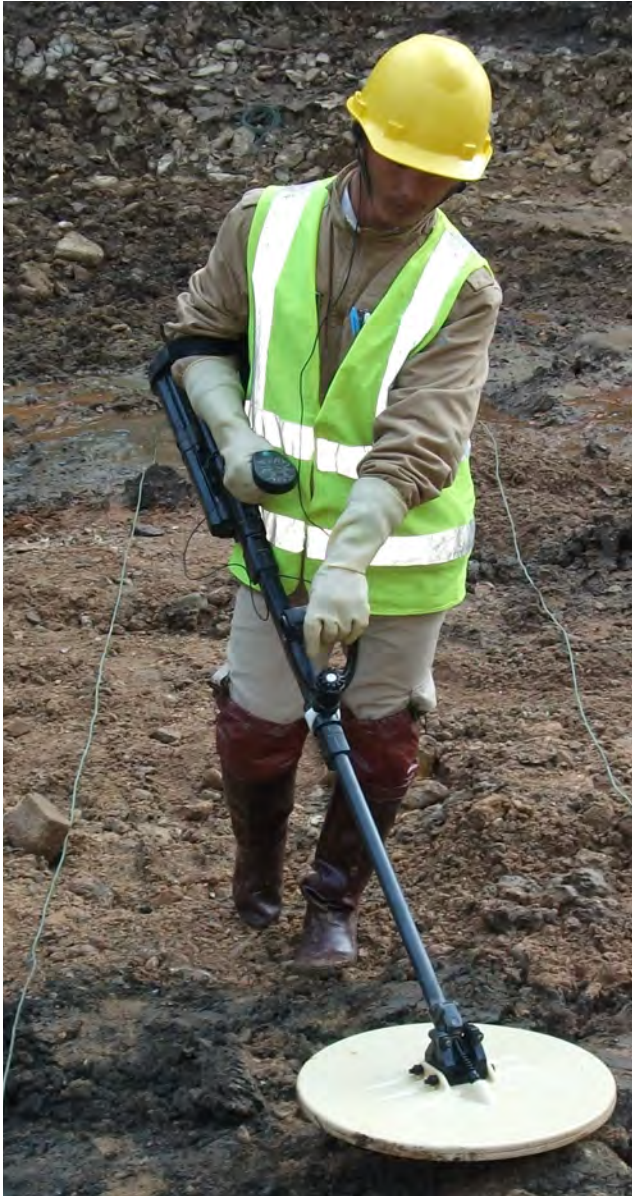
ການຊອກຫາ ລບຕ ໂດຍນຳໃຊ້ເຄື່ອງກວດລາດລູບໜ້າກວ້າງ.

ມິວເຊິດສ໌ ສັນຍາວ່າຈະຈະສືບຕໍ່ປະຕິບັດການກວດກູ້ ລບຕ ເພື່ອຫຼຸດຜົນຜົນກະທົບຈາກ ລບຕ ຢູ່ໃນ ສປປ ລາວ ຕໍ່ໄປອີກໃນອະນາຄົດ ແລະ ຈະສືບຕໍ່ຮັກສາຊື່ສຽງທີ່ວ່າ “ເປັນບໍລິສັດເກັບກູ້ ລບຕ ທີ່ດີເລີດຢູ່ໃນຂົງເຂດອາຊີ”.