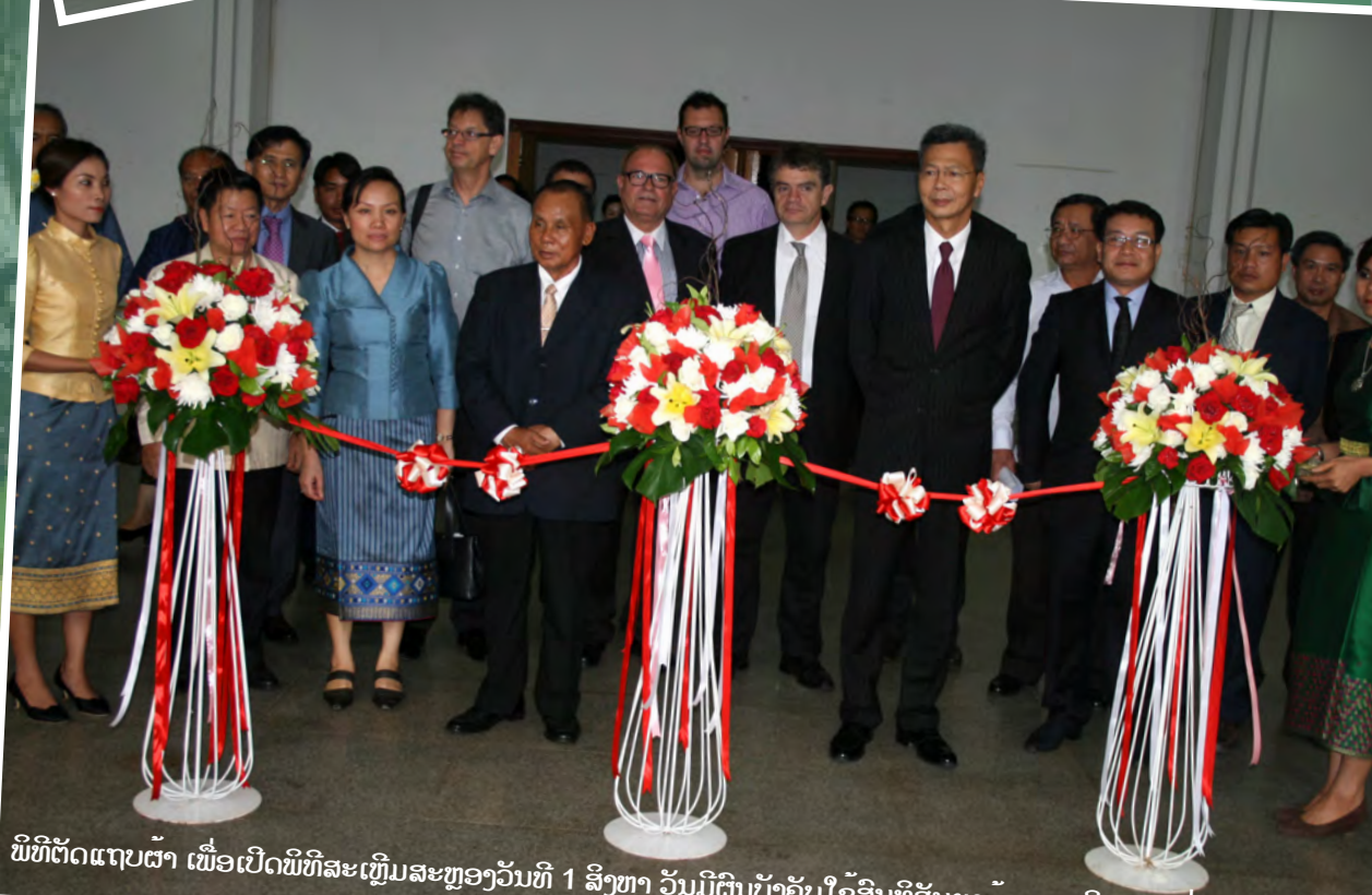
ພິທີຕັດແຖບຕົ້ນ ເພື່ອເປີດພິທີສະເຫຼີມສະຫຼອງວັນທີ 1 ສິງຫາ ວັນມີຜົນບັງຄັບໃຊ້ສິນທິສັນຍາຕ້ານລະເບີດລູກຫວ່ານ.